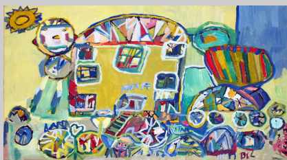
Gaia Museum Outsider Art