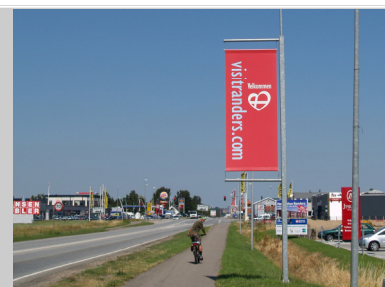
Vi byder igen velkommen ved indfaldsvejene